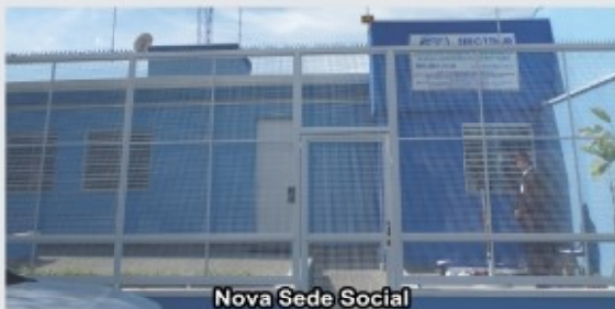
Nova Sede Social