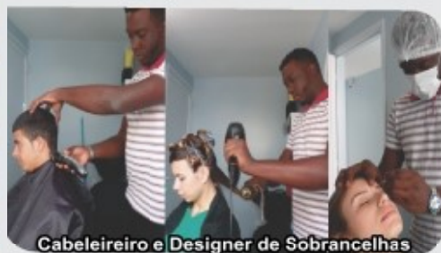
Cabeleireiro e Designer de Sobrancelhas