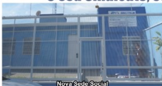
Nova Sede Social

O seu Sindicato, com a estrutura que você merece!