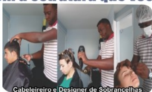
Cabeleireiro e Designer de Sobrancelhas